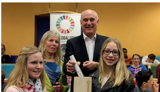
Capsule temporelle à Sitterd Geleen, Pays-Bas

Une capsule temporelle a été mise en place dans le but de sensibiliser les élus et le grand public . Les maires et les échevins néerlandais ont été invités à formuler leur souhait avant 2030 et à le partager avec les acteurs locaux, les OSC et les écoles, entre autres. Ces messages ont été enfermés dans des capsules cylindriques en bois qui seront ouvertes en 2030.